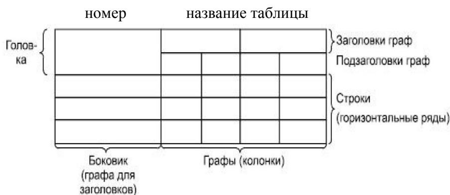
Таблица _____ - _____

Наименование таблицы следует помещать над таблицей слева, без абзацного отступа в одну строку с ее номером через тире. Наименование таблицы приводят с прописной буквы без точки в конце. Если наименование таблицы занимает две строки и более, то его следует